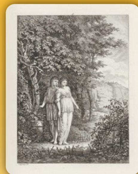
Gravure de Salomon Gessner (1730-1788) pour ses Idylles, Bibliothèque nationale de France, Paris.