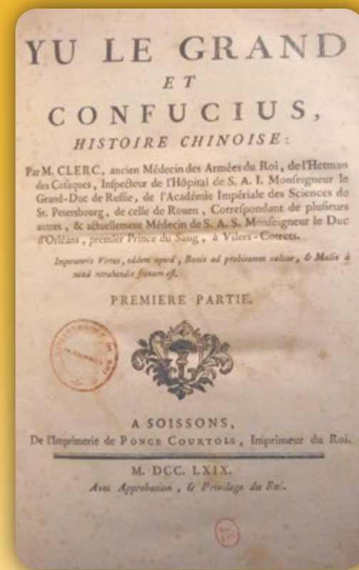
Yu le Grand et Confucius de la bibliothèque de Saint-Just, aujourd'hui conservé à la Bibliothèque nationale de France, Paris.