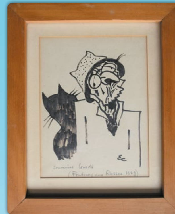
Caricature de Paul Léautaud