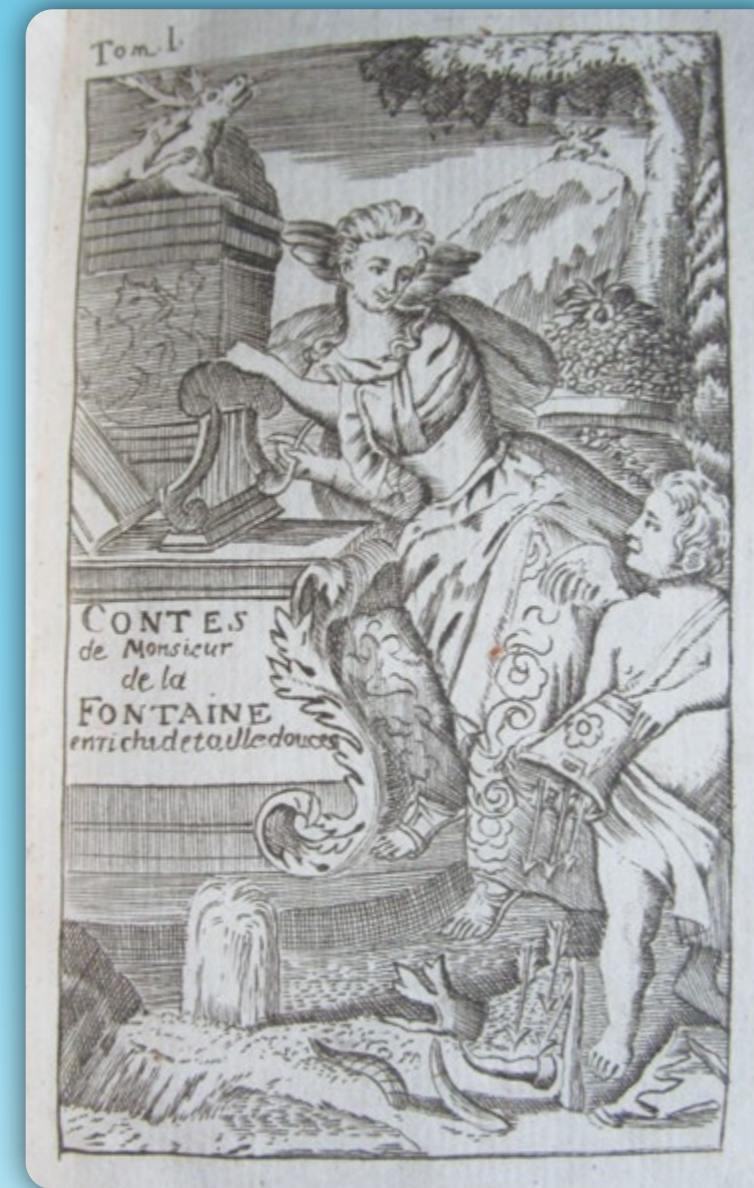
Édition des Contes du 18 e , © musée Jean de La Fontaine.