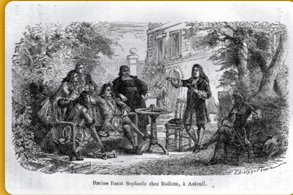
Dessin de P. Philippoteaux, gravure du 19 e siècle, collection particulière.