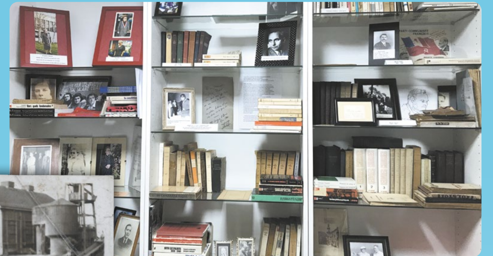
La bibliothèque d'Henri Martel, © Centre Henri Martel de Documentation et de Recherches de l'Histoire Sociale du Bassin Minier.