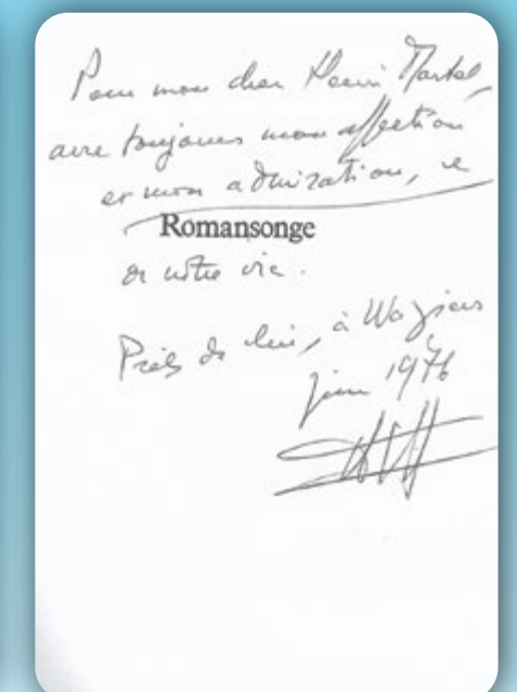
Dédicaces d'André Stil à Henri Martel : Le Foudroyage , Romansonge , © Centre Henri Martel de Documentation et de Recherches de l'Histoire Sociale du Bassin Minier.