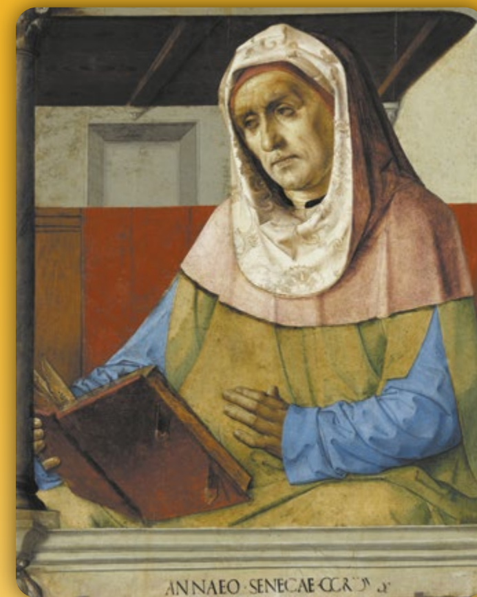
Sénèque, philosophe romain (2 ap. J.C.-65), Berruguete Pedro (vers 1450-avant 1504), Juste de Gand (actif vers 1460-vers 1480), huile sur bois, Paris, musée du Louvre, 07-537201, inv. MI 654.